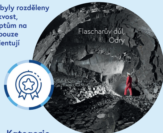
Flascharův důl, Odry