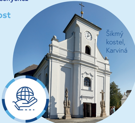
Šikmý kostel, Karviná