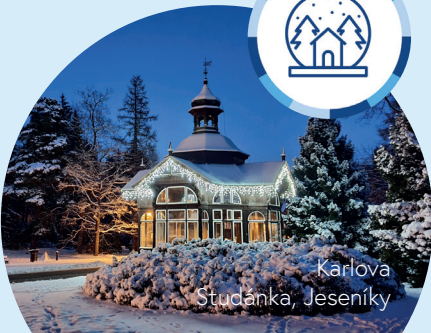
Karlova Studánka, Jeseníky