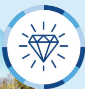
Meandry Odry, Bohumín